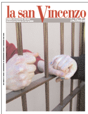
In copertina: Una mano tesa per chi attende la libertà